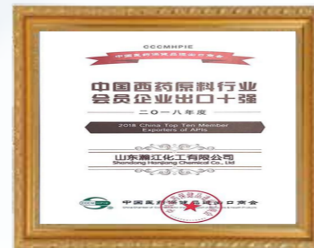
淄博市高新技术企业 Zibo High-tech Enterprise