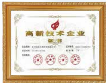
国家高新技术企业 National High-tech Enterprise