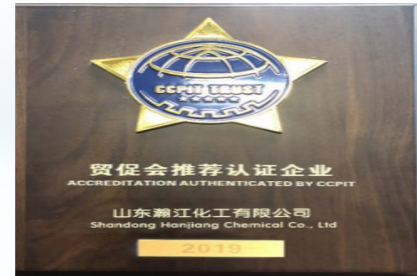
中国生化制药工业协会多肽分会理事单位 Governing Unit of Peptide Branch of China Biochemical Pharmaceutical Industry Association