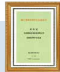
省科技型中小企业 Provincial Sci-Tech Enterprise