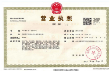
“雏鹰计划”企业证书 “Chuying” Enterprise