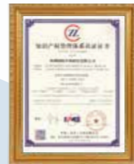
知识产权管理体系认证证书 Intellectual Property Certification