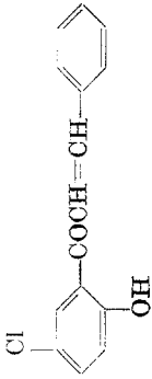
Tabelle 4. Chalkone aus 2-Hydroxy-5-chloracetophenon